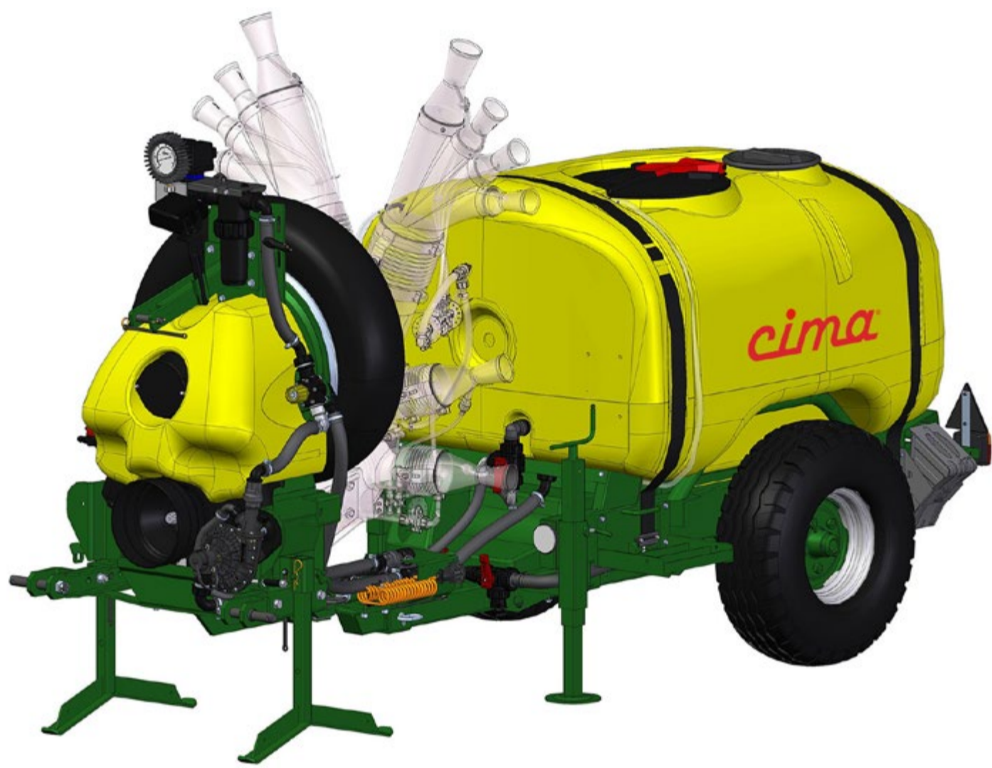
LINK 55 - Pulvérisateur articulé Pulvérisateur articulé série

PULVÉRISATEUR ARTICULÉ PNEUMATIQUE BAS VOLUME LINK55 AVEC ÉQUIPEMENT MULTI VITIS 6